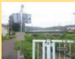
荒久沢川 乗附小学校

一般質問や委員会質疑等で要望してきた「河川監視カメラの動画配信」が、動画サイトYouTubeの県公式サイト「ツルノス」で始まりました。これまでは5〜10分間隔で静止画のみを公開していましたが、動画をリアルタイムで配信し、豪雨時に水位の上昇などの状況を安全に確認でき、迅速な避難につなげて頂けるようになります。