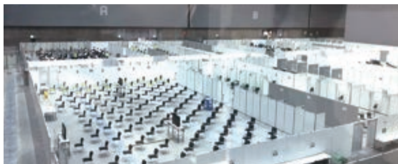
Gメッセ群馬に設置された「県央ワクチン接種センター」

農政部長 果樹への被害は、高崎市を含む7市町の果樹園において、被害が認められています。防除対策については、薬剤の散布、幹へのネットの巻きつけ、被害木の伐採など重点的に実施しております。